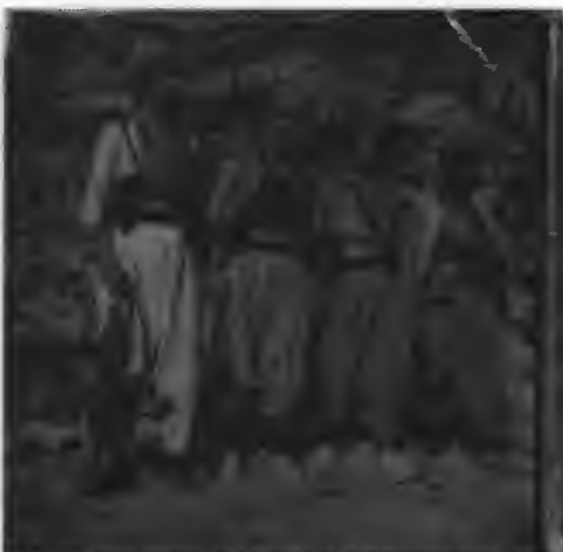
ئە راستمۇدە يۇ چەپ: مامۇستا شاھەر، پشكۆ ئە جەمەدىن، مەلا بەختيار جەمە نارات، گوندى ھاوارە كۆن، 1978