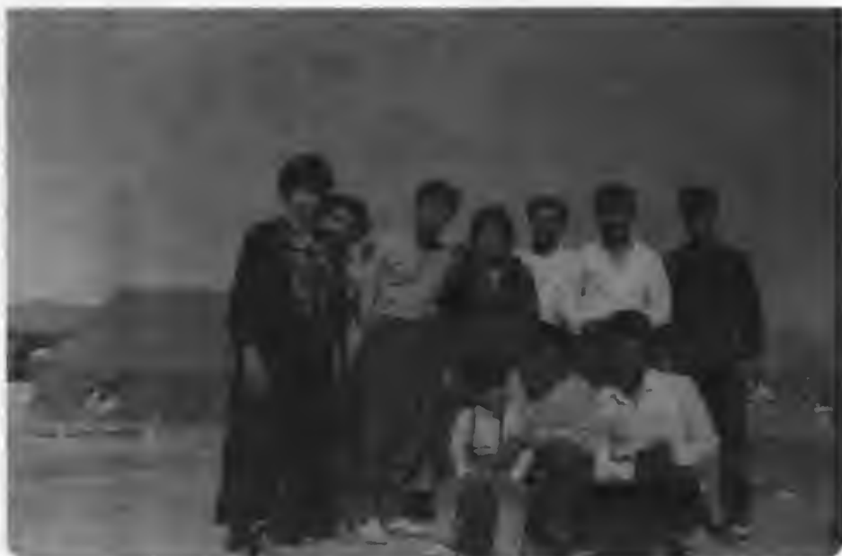
نۆردوگای ھەنە بجدییمکان، نیران (موتقور) ھاوینی 1988