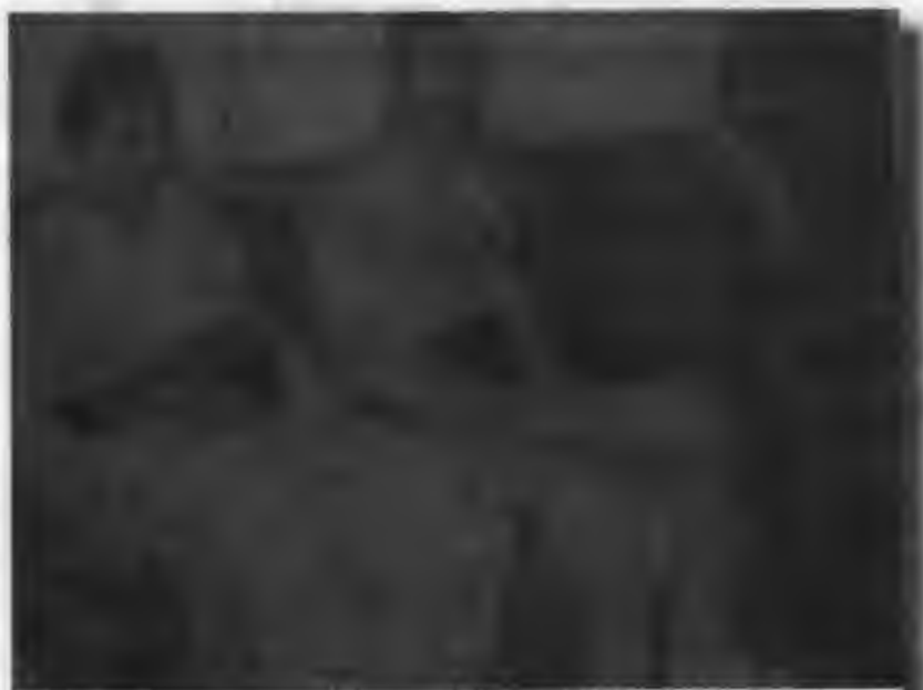
نە راستەو: مەلا بەختیار، نەوشیروان مستەفا، ماجەلال