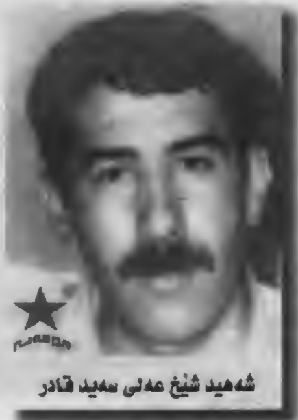
شەھید شیخ عەلی سەید قادر